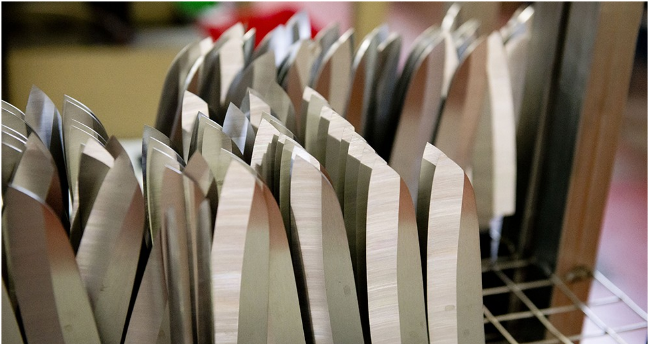
Les couteaux de la gamme « Evercut » ont des lames en acier dont l'usure est 300 à 400 fois plus lente - François Berrue

DENIS MEYNARD (HTTPS://WWW.LESECHOS.FR/JOURNALISTES/INDEX.PHP?ID=196) | Le 26/10 à 14:10 | Mis à jour à 16:10