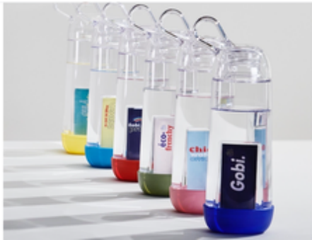
[Un Noël made in France] Les gourdes éco-conçues de Gobilab contre les déchets plastiques