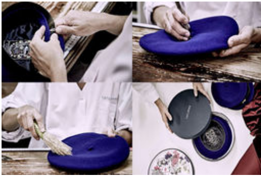
[Un Noël Made in France] Un morceau de Pays Basque avec le béret Lauhère