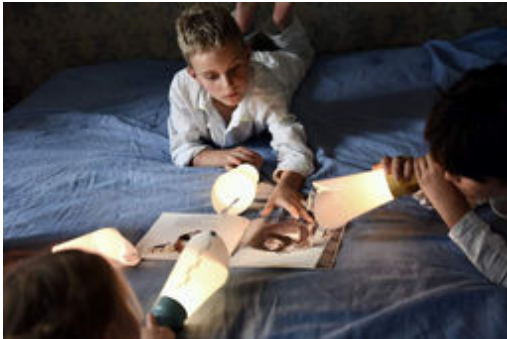
[Un Noël Made in France] Les lampes nomades de Polochon&Cie