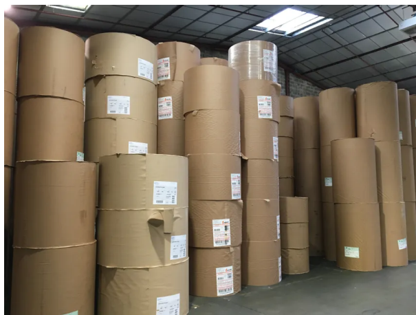
Chaque bobine correspond à 30 000 mètres de papiers. Il suffit d'une matinée pour imprimer l'ensemble de la bobine.