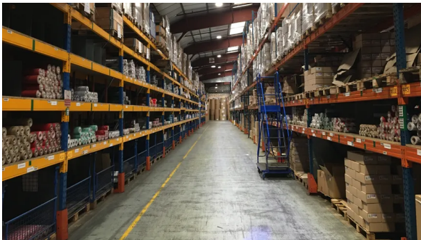
La papeterie du Poitou est le leader français de l'emballage cadeaux.

A Beaumont Saint-Cyr, dans la Vienne, la papeterie du Poitou est le leader français du papier cadeau. Des emballages qui s'exportent partout dans le monde. Chaque année, c'est plus de 5000 tonnes de papiers cadeaux qui sortent de l'usine dirigée par Pascal Pellerin.