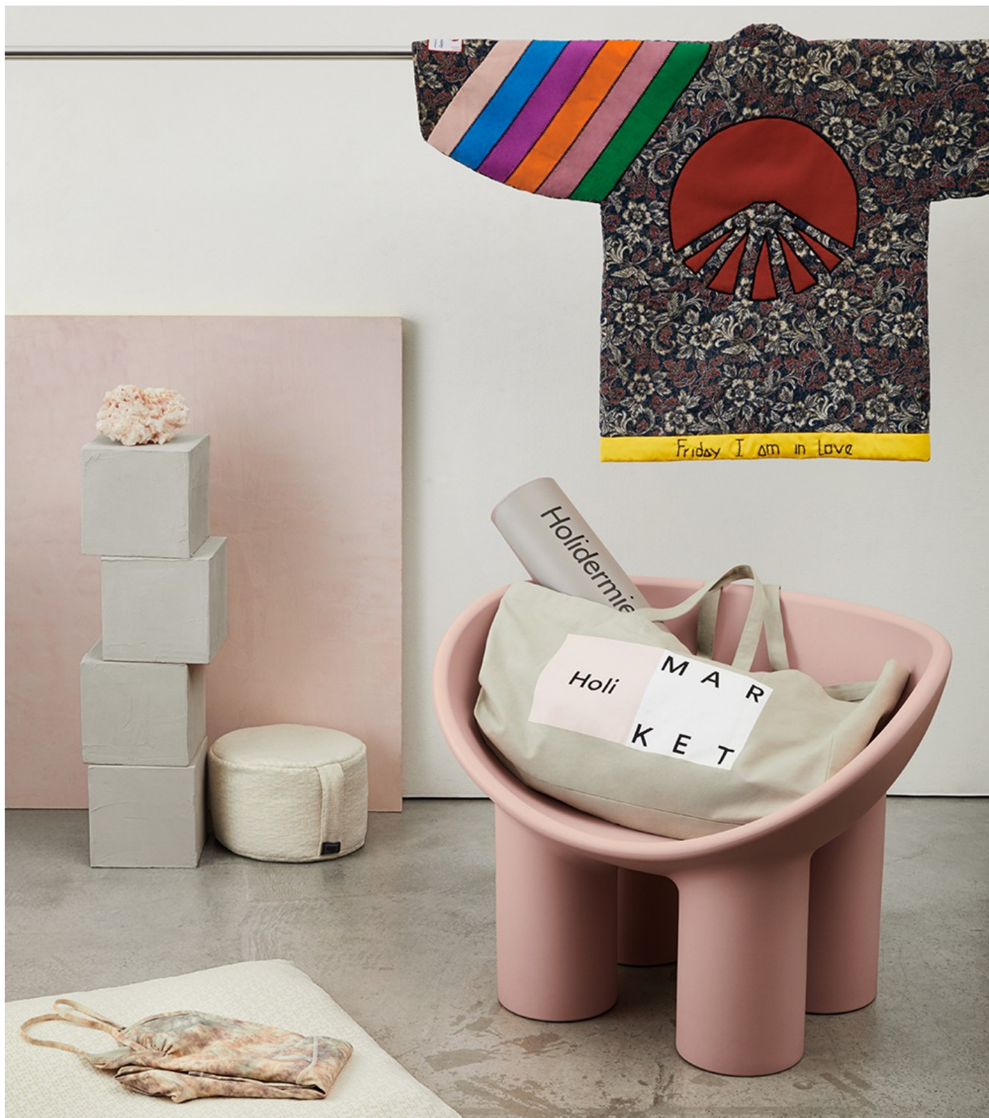
Installé au Bon Marché Rive Gauche, le HoliMarket est le nouveau pop-up wellness de la capitale.