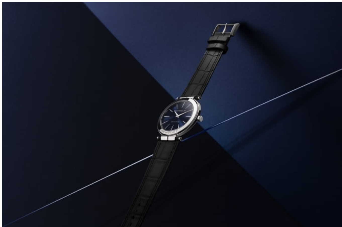
Montre Michel Herbelin