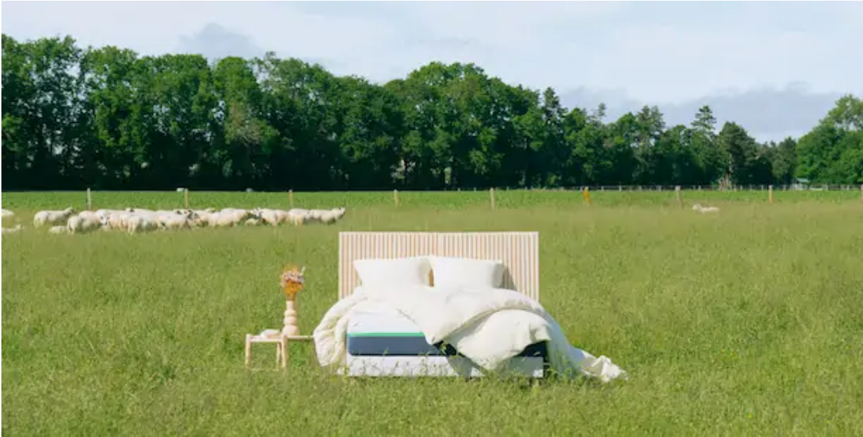
Un matelas éco-conçu, fabriqué en France à partir de matières écologiques

Pour acheter un matelas écologique , on peut regarder d'abord le lieu de fabrication. Il existe encore quelques fabricants de matelas français : la marque Tediber fabrique ses matelas Pelote en France ! En outre, il convient d'être vigilants sur les matériaux utilisés : un matelas écologique peut être composé de laine ou encore de mousse recyclée.